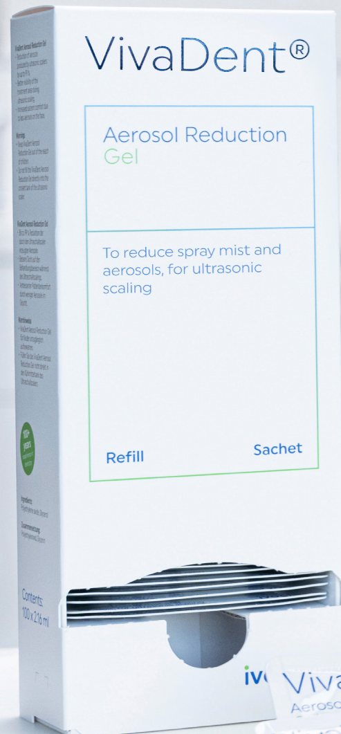
Scaler ultrasónico con ViaDent Aerosol Reduction Gel