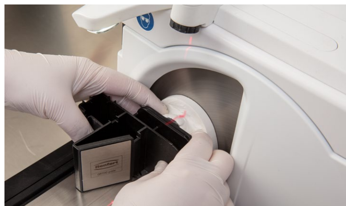
Recorte preciso, considerando todos los planos oclusales, con plantilla intuitiva