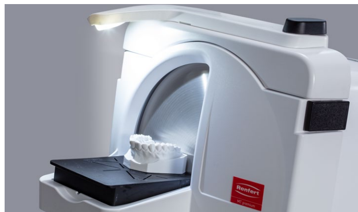
Iluminación óptima de la zona de trabajo